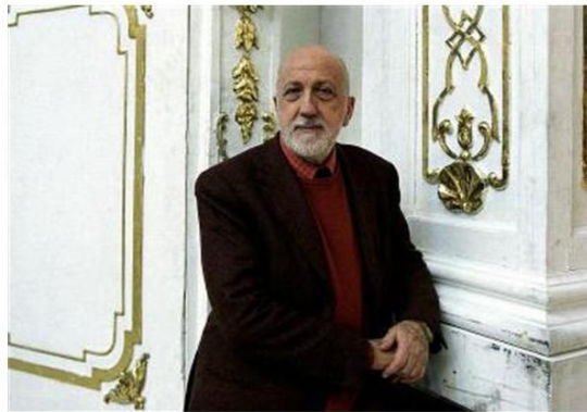
Pier Luigi Pizzi, 93 anni: oggi parlerà all'UlisseFest, ore 17, allo Sperimentale