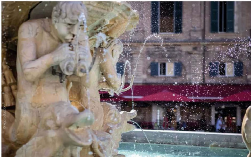
La fontana di piazza del Popolo a Pesaro