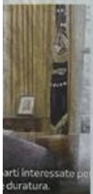
arti interessate per duratura.

atta di una figura elligenza artificiale. è stato creato della p fake, le sue rispo- e ottenute tramite i, con delle semplici più facile costruire questo tipo», ha di- rto Carraro.