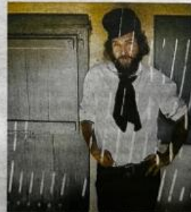
Vinicio Capossela

PESARO L'anteprima di UlisseFest sarà domani, giovedì 13 luglio, alle 21.30, in piazza del Popolo, con il concerto di Vinicio Capossela e le sue "Tredici canzoni urgenti". «Sono contento di tornare a Pesaro e, dopo Rossini, dedicare questo concerto a Ulisse», conferma Capossela, «soprattutto perché non è una tappa di tour, ma qualcosa pensato apposta per questa data». Il viaggio è importante per Vinicio, «persino questo album è stato registrato in posti diversi, la musica è fatta per non essere stanziale, non c'è niente di più portatile della musica».