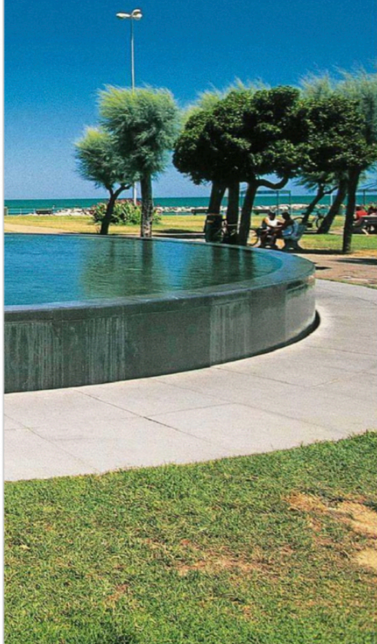
La Sfera Grande di Arnaldo Pomodoro a Pesaro

Q uando ci si mette in viaggio, persino per uno di quelli interiori, si è perennemente in bilico tra il desiderio tentacolare di perdersi nel disordine dell'ignoto e quello di ritrovarsi nella dimensione romantica della poesia, che solo l'uscire dalla propria zona di comfort regala ai più audaci.