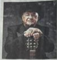
Eliades Ochoa, 77 anni

Il regista romano Paolo Genovese, 56 anni