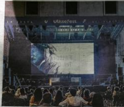
La passata edizione della festa di Lonely Planet che fa tappa di nuovo a Pesaro con un programma ricco di spunti e idee per viaggiare, approfondire e divertirsi

CRISTICCHI E AMARA NEL CONCERTO MISTICO PER BATTIATO