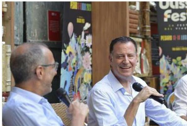
Due gli incontri di Bill de Blasio col sindaco ieri a Pesaro. Il primo nel cortile dei musei Civici, il secondo in piazza del Popolo

L'ex primo cittadino della metropoli Usa ha ricordato che la sua famiglia era partita da Benevento