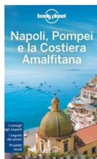
La guida di Napoli in testa alle vendite

16 luglio parlerà di turismo a 360°, nel corso di 50 eventi che vedranno partecipare oltre 150 personalità del panorama culturale italiano, tra scrittori, giornalisti, artisti e semplici viaggiatori, fotografi di viaggio e reporter, poeti, influencer ed esperti di comunicazione digitale. Tra gli ospiti, quest'anno, oltre al fondatore di Lonely Planet Tony Wheeler , anche Vincenzo Capossela , l'ex sindaco di New York Bill De Blasio , Umberto Galimberti ed Eliades Ochoa . Il 14 luglio la manifestazione ospiterà il «Concerto mistico per Battiato», di Cristicchi e Amara , una sorta di viaggio in musica tra le tradizioni spirituali del mondo.